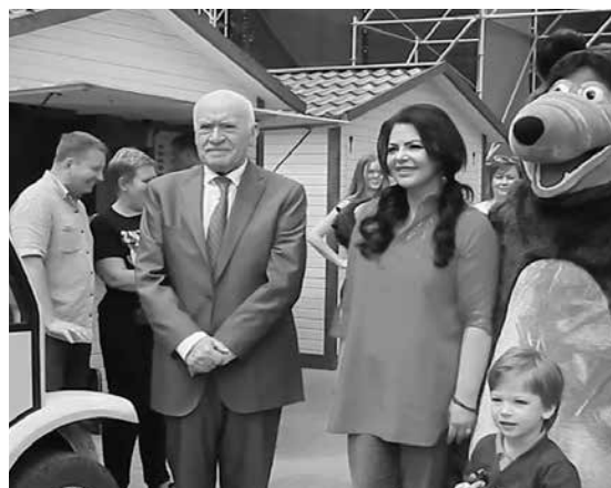
Бокерия поделился секретами здорового образа жизни.

В ходе своего выступления Лео Бокерия рассказал о том, что в России рождается примерно 10 тысяч детей с пороками сердца, и почти всем из них можно помочь и дать каждому дол-